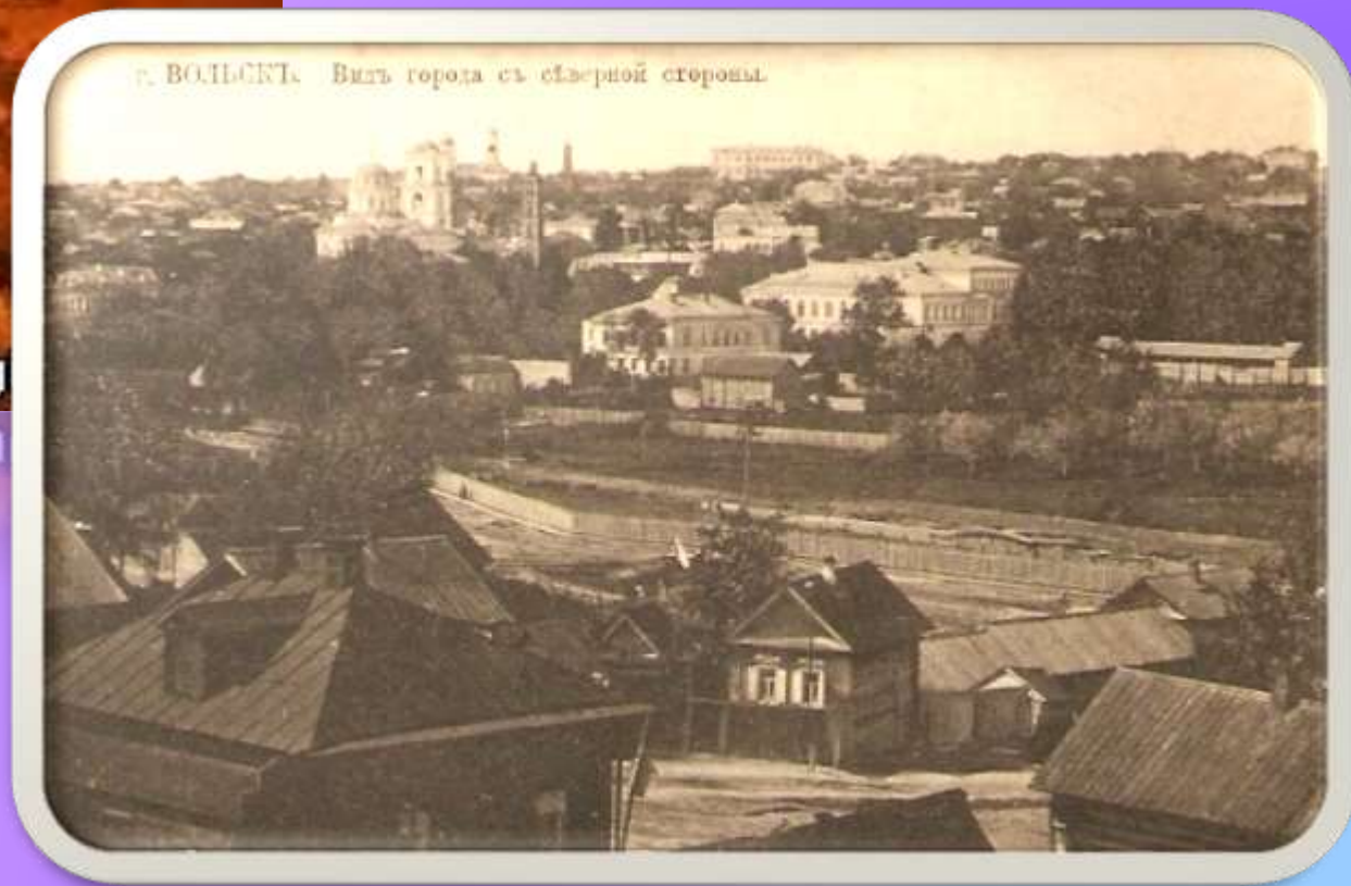
г. ВОЛЬСКИ. Видъ города съ сѣверной стороны.