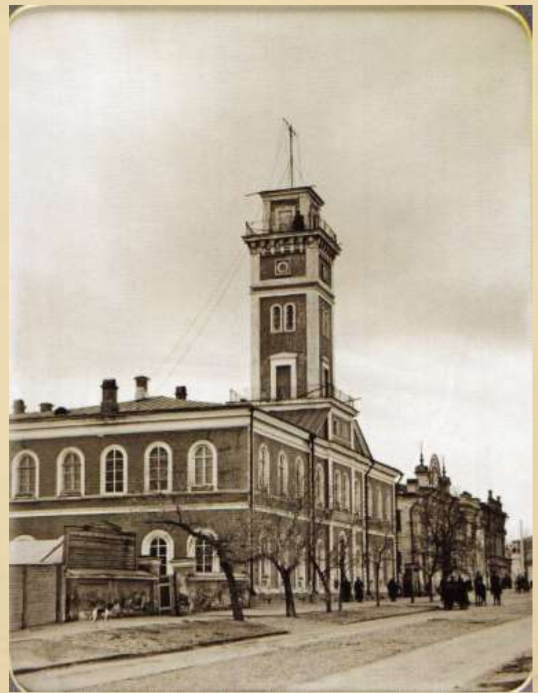
Городское полицейское управление