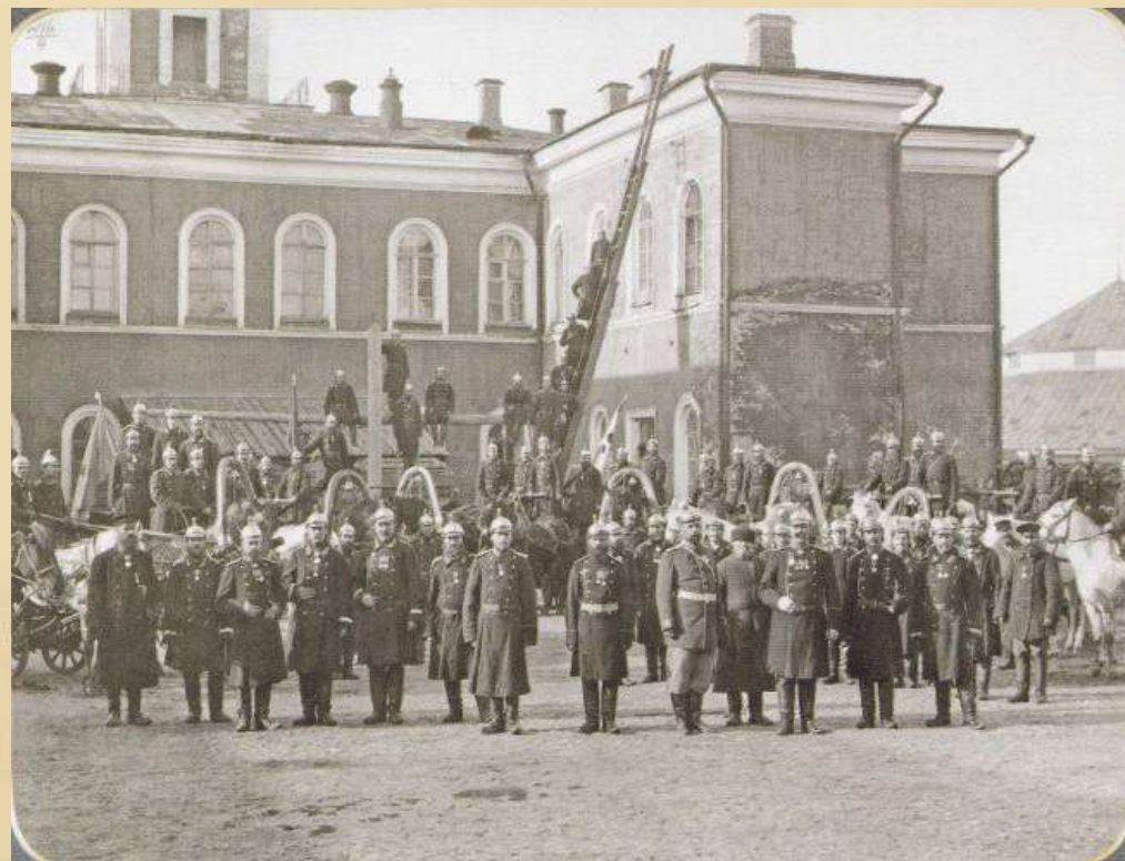
Саратовская пожарная команда

Самые серьёзные проблемы губернатору Ланскому доставила серия пожаров, произошедших летом 1800 и 1801 годов. Пожары в давние времена не раз опустошали наш город, и всегда причиняли серьёзный материальный ущерб.