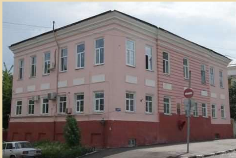
Главное народное училище

В 1797 году завершилось генеральное межевание земель Саратовского края. В Саратове также провели ряд территориальных преобразований и построили Главное народное училище (сейчас детский сад на Музейной площади рядом с краеведческим музеем).